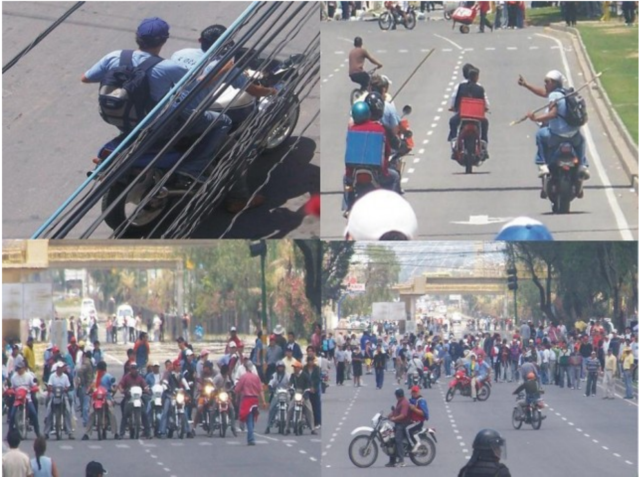
Jóvenes vistiendo las camisetas de la agrupación Juventud K'ochala obligan a acatar el paro cívico del 29 de noviembre de 2007.